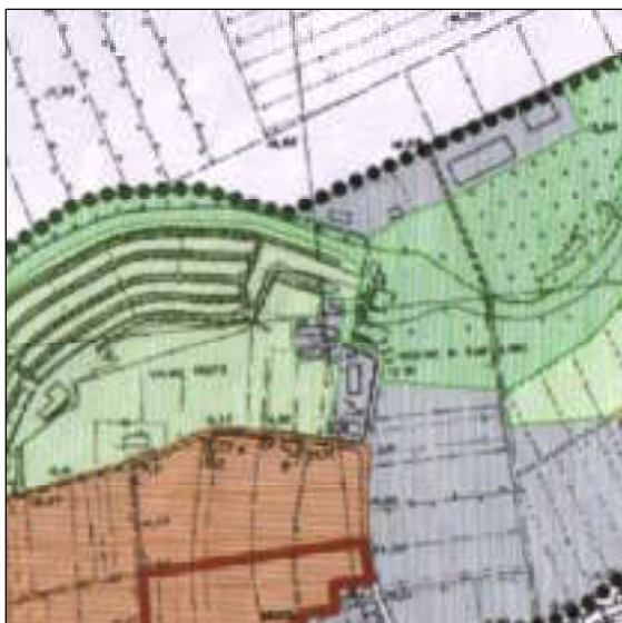
Piano Ambientale Vigente - scala 1:10.000