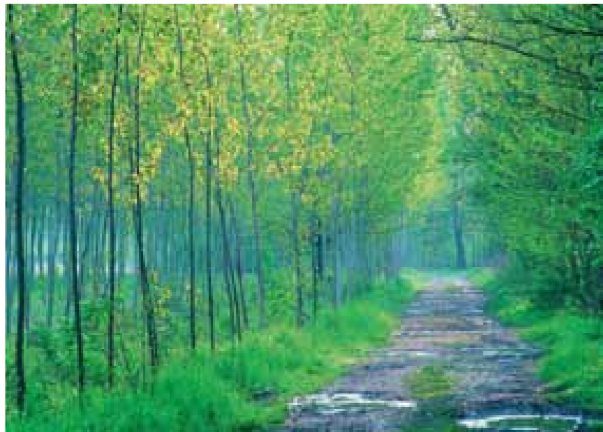
Il GiraSile nelle Risorgive. Percorso nel Gran Bosco dei Fontanassi

The distinctive activity of the territory is agriculture: among the typical products there is the white asparagus of Badoere IGP (fig. d) that lives in this soil with a sandy substrate. The importance of his cultivation is proved from the annual "Festa dell'Asparago" that takes place every first May in the Rotonda of Badoere.