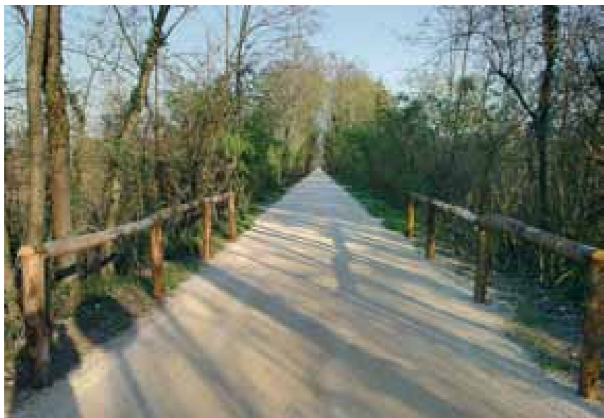
Il GiraSile tra Quinto di Treviso e Morgano. Percorso ciclopedonale della ex ferrovia Treviso-Ostiglia.

Between the freshwater fishes in the Sile river there is the eel, commonly know as " Bisata del Sile " (fig. d). This fish lives preferably in the see or in salty waters, but you can find it even 200 kilometres inside the coast in the rivers.