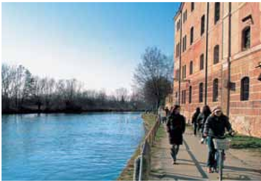
Il GiraSile a Treviso. Percorso ciclopedonale lungo le alzaie a Fiera.