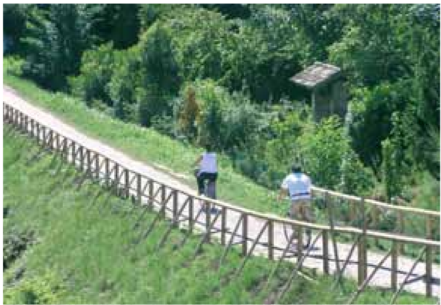
Il GiraSile a Quarto d'Altino. Percorso ciclopedonale lungo l'alzaia.

It is possible to visit the archaeological site of Altino (fig. c) that was inhabited since the 8th millennium, as some remains show. From the 7th century BC the Veneti lived in Altino and the Roman period began in the 2nd century BC when the Via Annia was built and the rivers' track were modified. Altino had its prime between the 1st century BC and the 2nd century AD. After a short period as bishop seat, the bishop went to Torcello, the city became swampy and the economic fall took place. The buildings were new building material for the people in the lagoon and the site was inhabited since the first drainages. Nowadays in Altino You find the National Archaeological Museum which contains remains coming from the city and from the necropolis. Some of them are inside the museum and some others are in loco. We are now near the lagoon where fishes and shellfishes (fig. d) are the most important ingredient of each dish.