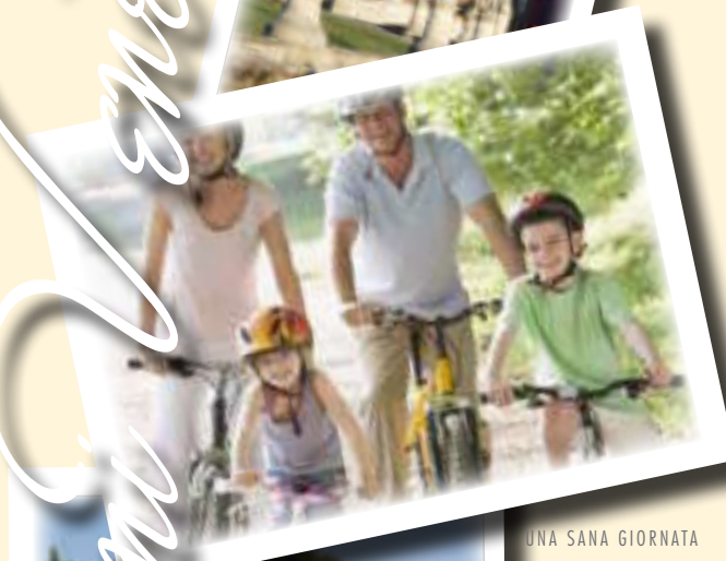
UNA SANA GIORNATA IN BICI TRA NATURA E STORIA