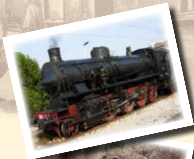
AUTENTICA LOCOMOTIVA A VAPORE

In Treno a Vapore e Bicieletta Pasquetta tra Padova e Treviso