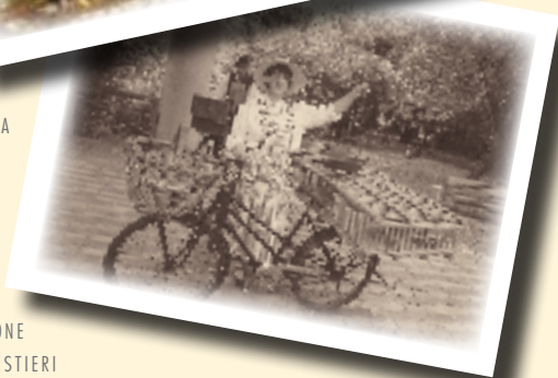
RIEVOCAZIONE ANTICHI MESTIERI