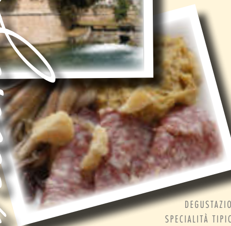
DEGUSTAZIONE SPECIALITÀ TIPICHE

VI ASPETTIAMO PER VIAGGIARE NEL TEMPO, TRA COLORI E SAPORI DELLA TRADIZIONE VENETA.