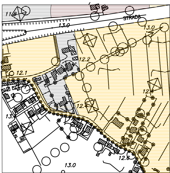
Piano Ambientale Variante - scala 1:5.000 Zona ad urbanizzazione controllata

NOTE Cambio da zona agricola ad orientamento culturale a zona ad urbanizzazione controllata. Si prende atto dello stato dei luoghi caratterizzato da un nucleo abitativo con numerose preesistenze edilizie poste al confine del Parco e al ridosso della tangenziale sud di Treviso. Detto ambito ha perso la vocazione agricola.