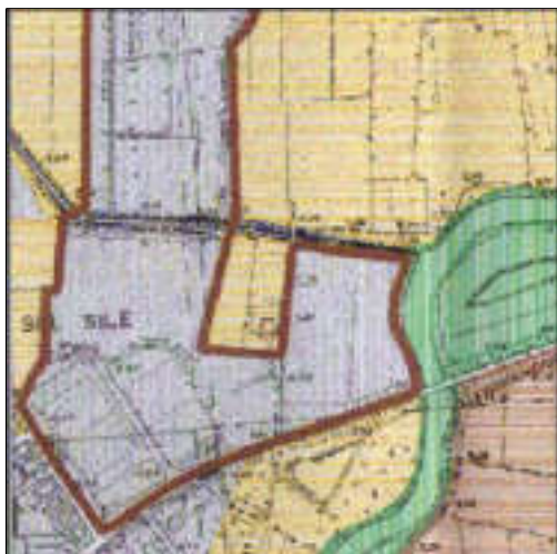
Piano Ambientale Vigente - scala 1:10.000 Zona Agricola ad Orientamento Culturale