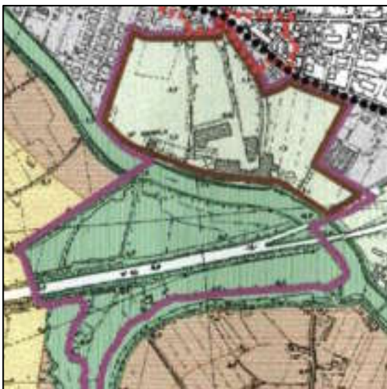
Piano Ambientale Vigente - scala 1:10.000