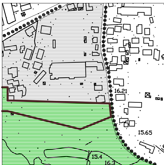
Piano Ambientale Variante - scala 1:5.000

Zona a riserva naturale orientata con funzioni di interesse pubblico