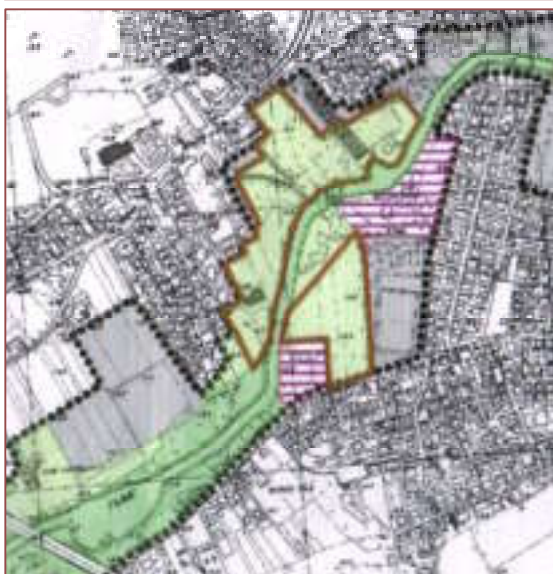
Piano Ambientale Vigente - scala 1:10.000

Zona a ripristino vegetazionale con funzioni di interesse pubblico